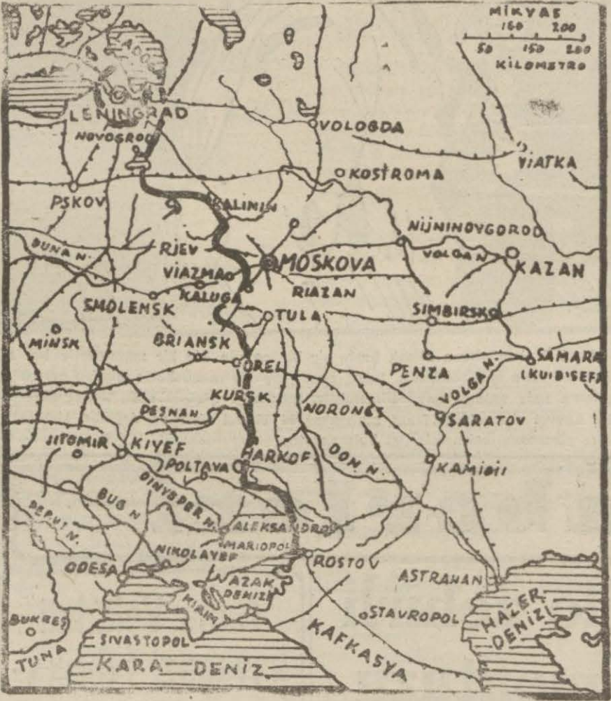
Şark cephesinin bugünkü vaziyetini gösterir harita

Cava denizinde 2 tayyare levazım ge-misi, 3 levazım gemisi hasara uğratılmıştır.